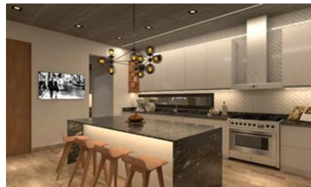
Housing es una marca pionera de luminarias embutidas en losas de hormigón a la vista